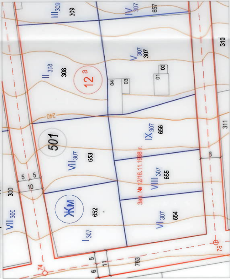
ПЛАН ЗА РЕГУЛАЦИЯ

от Кадастралната карта на с. Щипско, одобрена със Заповед № РД-18-34/22.01.2019 г. на ИД на АГК и регулационния план на с. Щипско, одобрен със Заповед № 65/10.03.1993 г. на Кмета на Община Вълчи дол